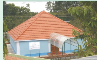
द ग्रेट रा मेडिटेशन हॉल